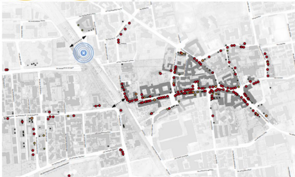
Grado di rilevanza urbana