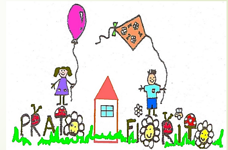
Asilo Nido Comunale Prato Fiorito