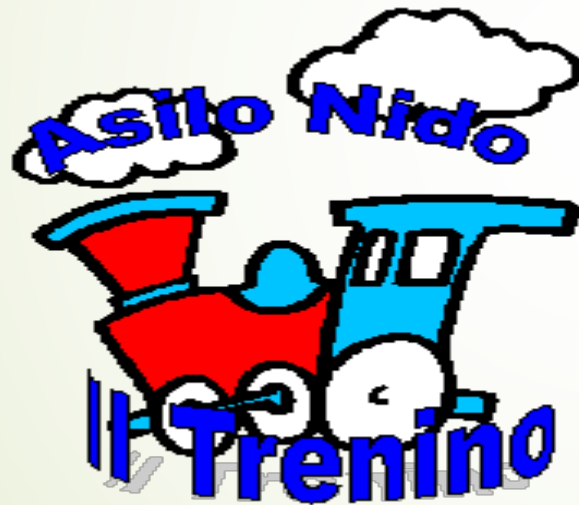
Asilo Nido Comunale Il Trenino