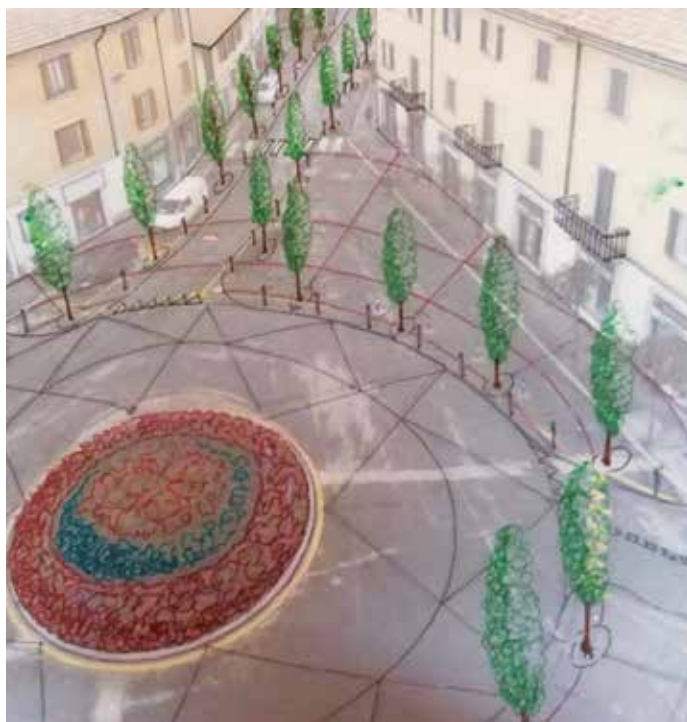
▲ Riqualficazione di Piazza della Chiesa

Interventi di riqualficazione delle palestre scolastiche di Via G. Brodolini e via C.Prampolini ►