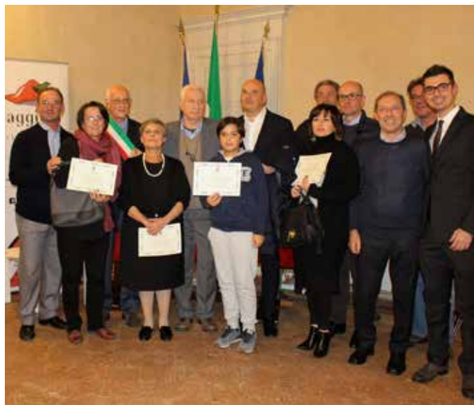
La premiazione delle attività storiche

Festa, lunedì 14 novembre, in Villa Venino, per la consegna dei riconoscimenti, da parte dall'Amministrazione Comunale, a sette esercizi commerciali attivi sul territorio da almeno 50 anni, negozi "storici" premiati anche dalla Regione Lombardia.