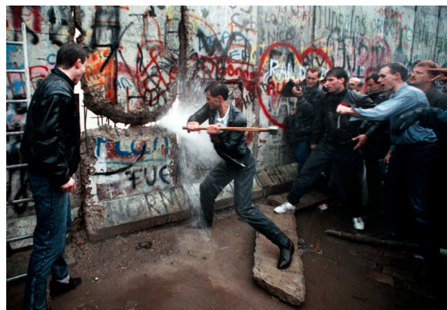
9 Novembre 1989: abbattimento del muro di Berlino

Il muro di Berlino (in lingua originale: "Berliner Mauer") era un sistema di fortificazioni che ha diviso la città tedesca dal 13 agosto 1961 al 9 novembre 1989 , per ventotto anni.